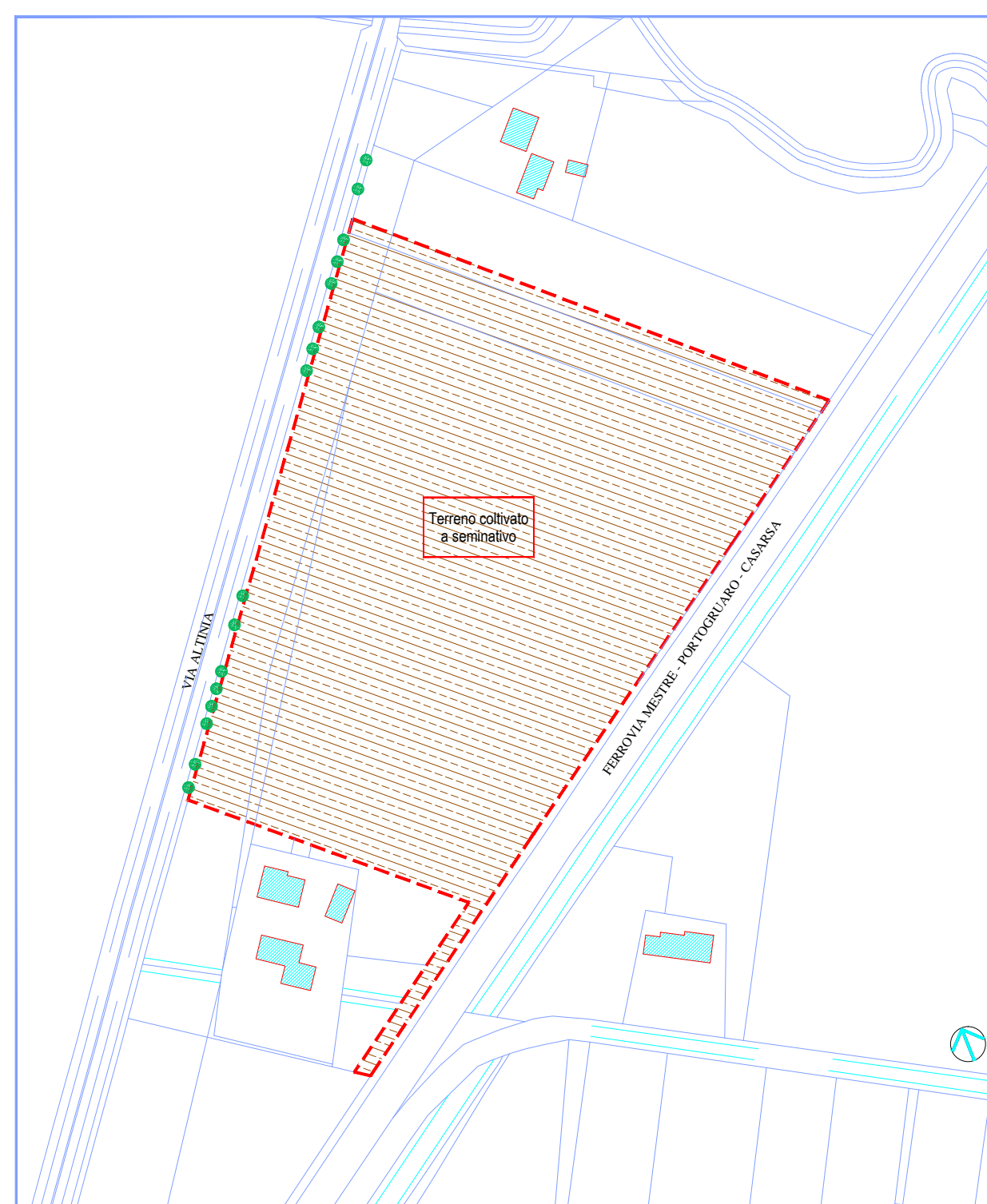
ESSENZE ARBOREE ED USO DEL SUOLO SCALA 1:2000