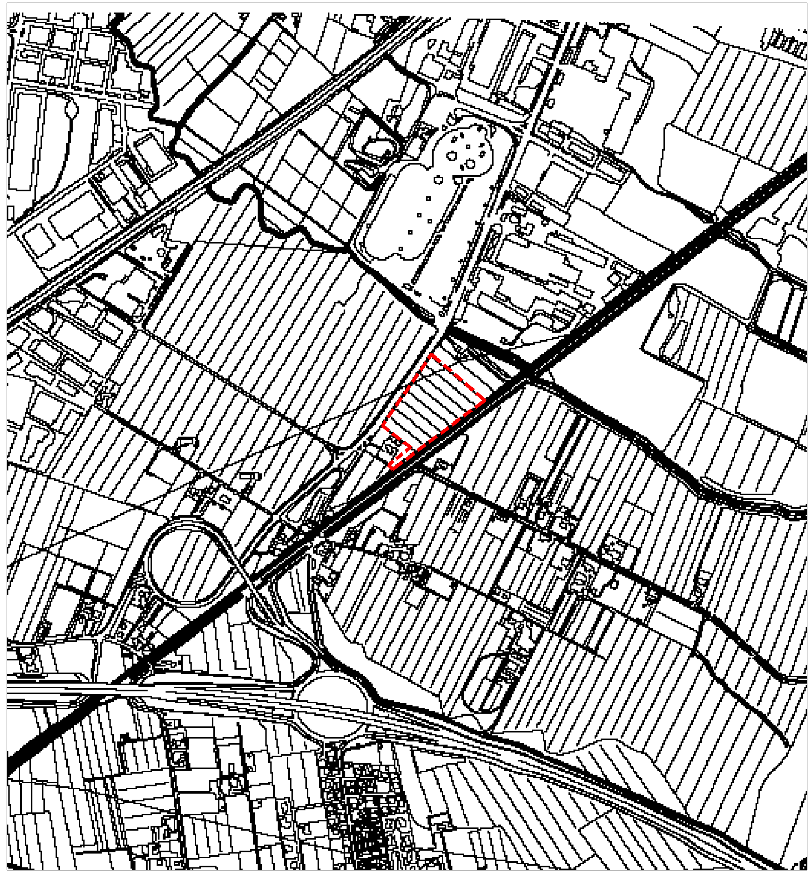
INQUADRAMENTO TERRITORIALE SCALA 1:10.000